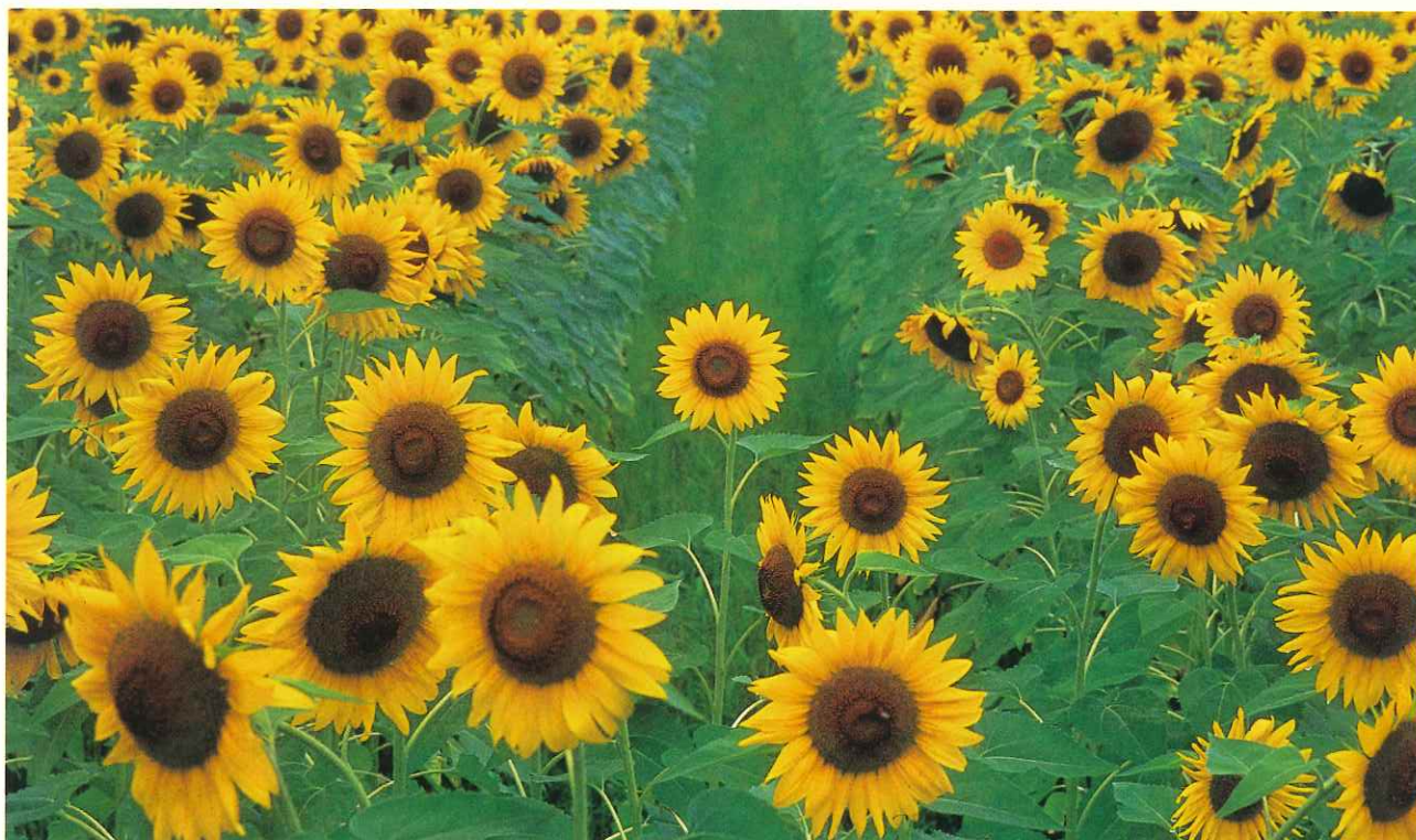
—孤高— (ひたちなか市) いばらき自然環境フォトコンテスト佳作