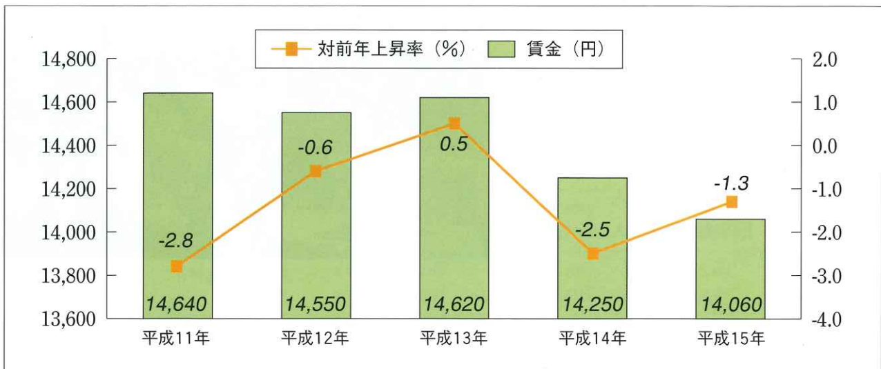
第1図 屋外労働者の賃金および対前年上昇率の推移（技能職種計）