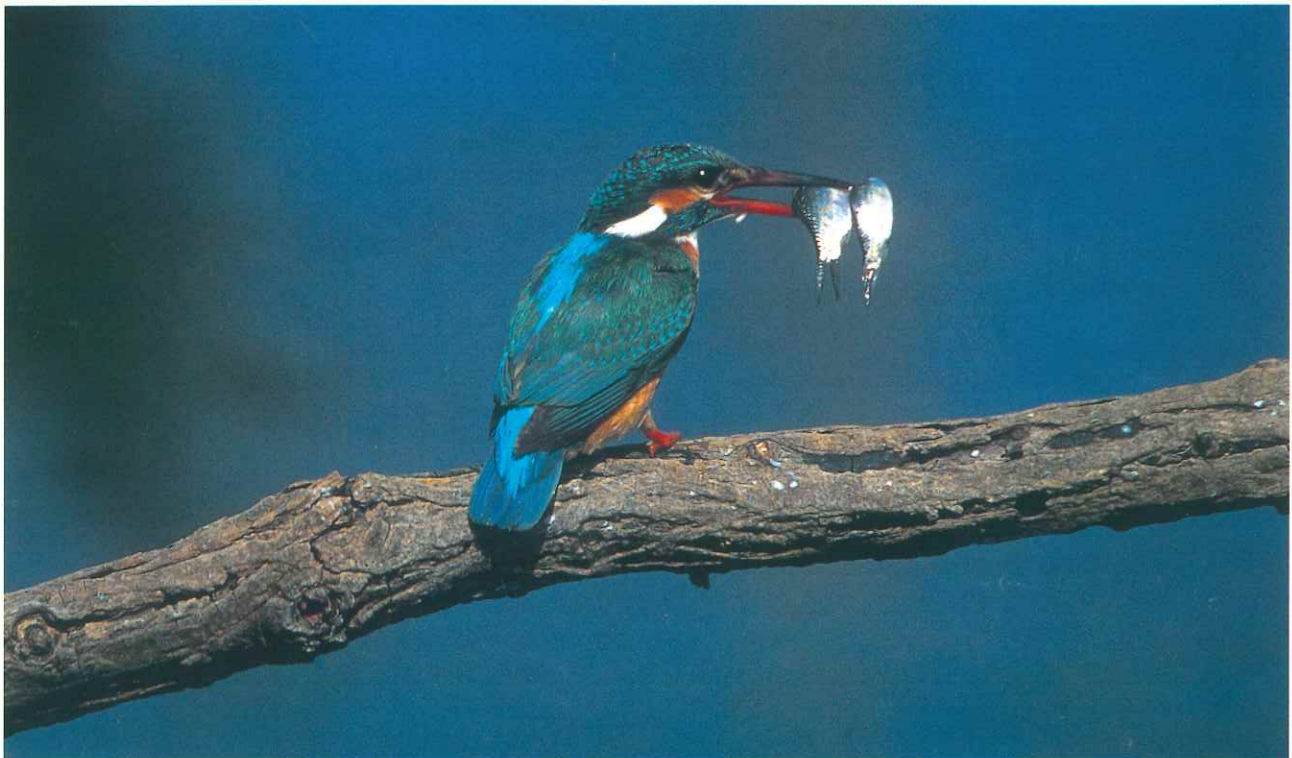
—豊かな自然— (潮来市) いばらき自然環境フォトコンテスト入選