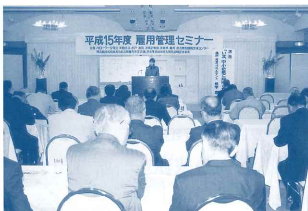
セミナーにおける講演