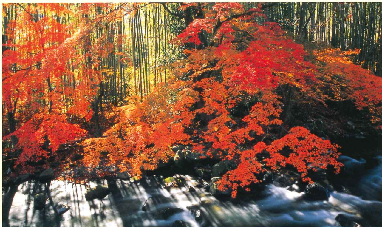
— 溪谷の秋 — (北茨城市) いばらき自然環境フォトコンテスト入選