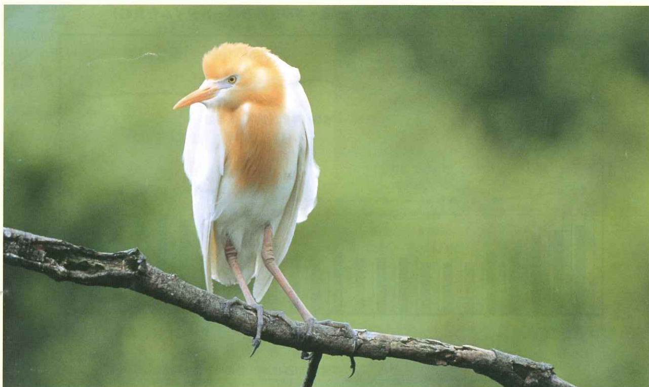
アマサギー（東町）いばらき自然環境フォトコンテスト県議会議長賞