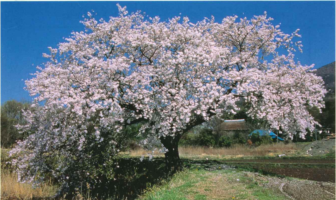
—春爛漫— (つくば市) いばらき自然環境フォトコンテスト佳作