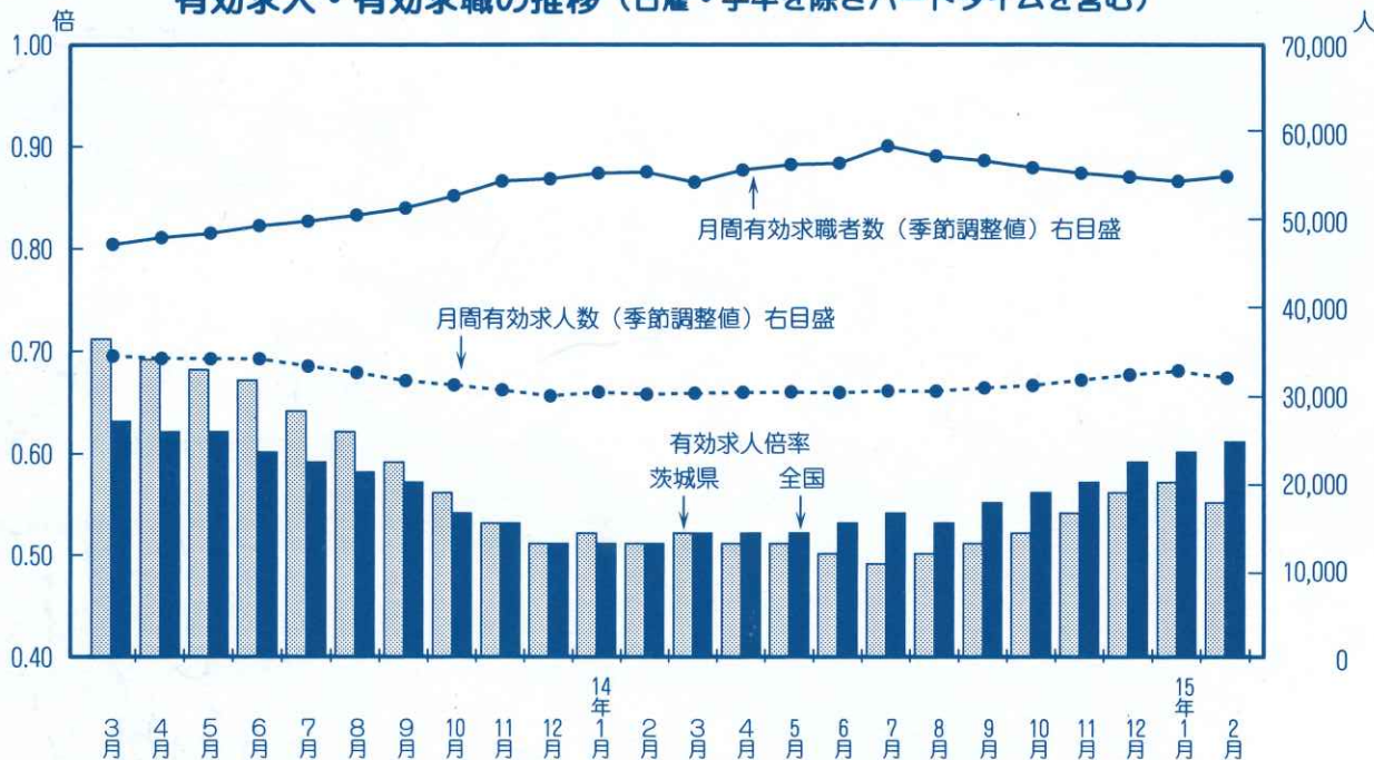
有効求人・有効求職の推移（日雇・学卒を除きパートタイムを含む）

雇用保険受給者実人員は、前年同月との比較では5.2%減少し、21,106人となりました。