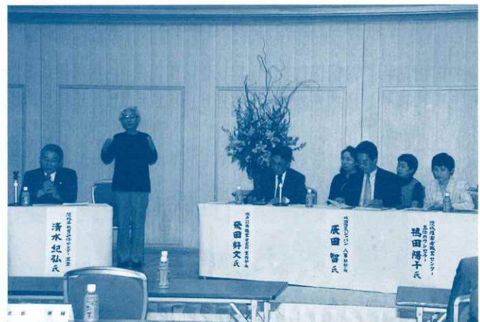
－ シンポジウムの様子 －