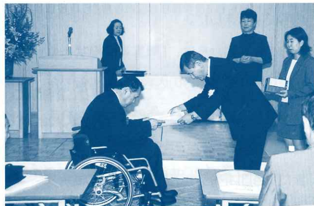
— 茨城県雇用開発協会長表彰 —