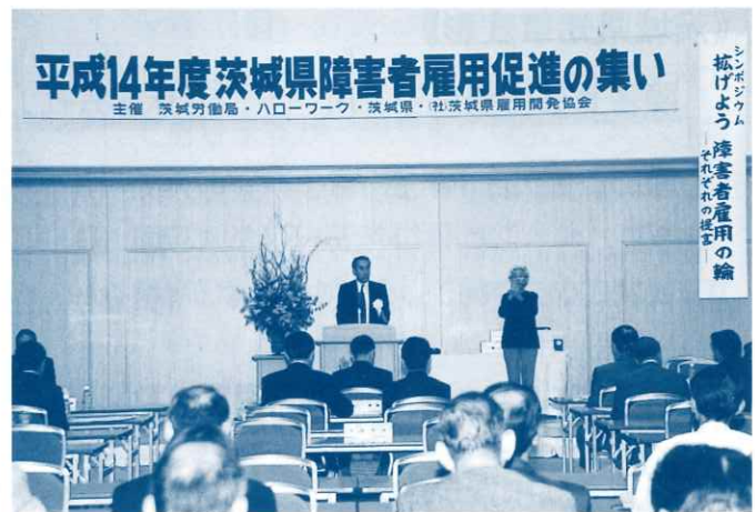
－ 主催者あいさつ －