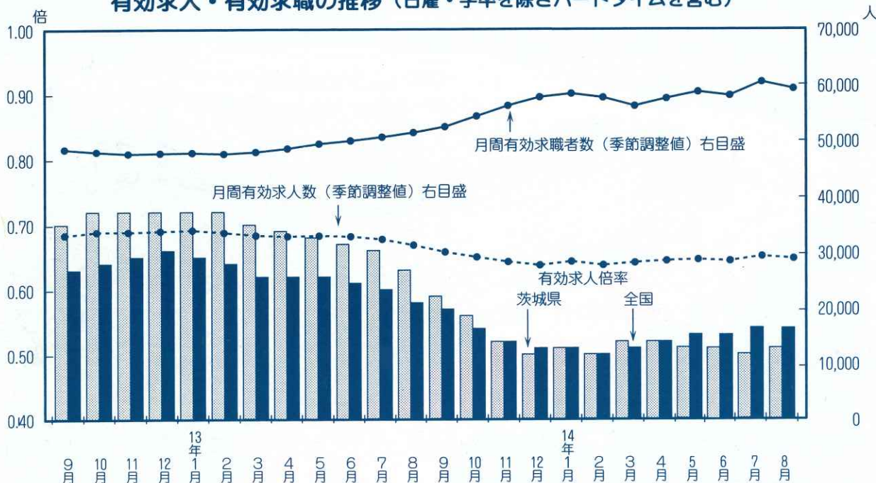
有効求人・有効求職の推移（日雇・学卒を除きパートタイムを含む）

8月の雇用失業情勢をみると、製造業における新規求人数が前年同月比で2か月連続して増加しましたが、運輸・通信業やサービス業で減少に転じ、全体では2か月ぶりに小幅な減少となりました。新規求職者数は、前年同月に比較して非自発的離職者や在職求職者の増加幅が大きく縮小し、定年到達者の減少もあって、17か月ぶりの減少となりました。有効求職者数は前年同月比7.3%減の29,460人となり、有効求職者数は同14.6%増加し59,546人となりました。求職者1人当たりの求人数を示す有効求人倍率は0.51倍（季節調整値）となり、前月を0.01ポイント上回りました。そうした中で、就職件数は3,171件となり前年同月比では1.7%増加、11か月連続の増加となりました。雇用保険受給者実人員は、前年同月との比較では19.7%増加し、26,373人となりました。