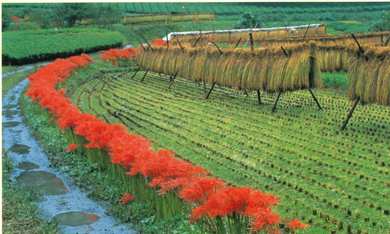
—里の秋— (大子町) いばらき自然環境フォトコンテスト入選