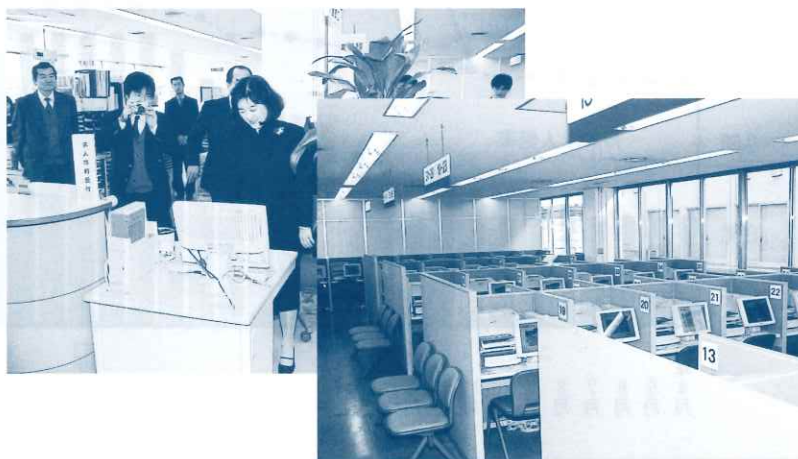
（追加導入された求人自己検索装置・ハローワーク水戸）

導入した形態は、タッチパネルで項目を追って検索を絞り込んでいくタイプで、選択項目はフルタイム求人、パートタイム求人、年齢、職種、賃金、週休二日制、就業場所などです。必要に応じて「求人一覧表」と「求人公開カード」が印刷でき、本人は勿論、家族等が本人に代わって求人情報の収集ができます。