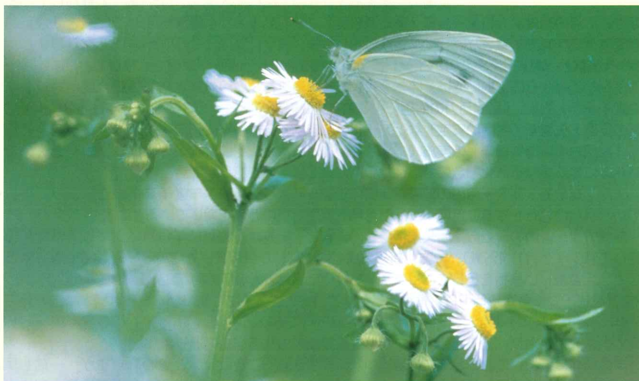
—蜜が憩う— (北茨城市) いばらき自然環境フォトコンテスト佳作