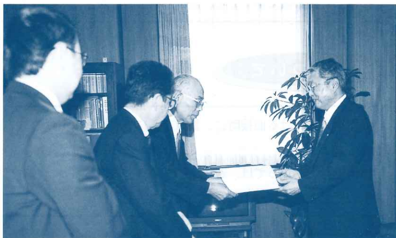
写真：福田商工労働部長（右）から要請文を受ける団体責任者