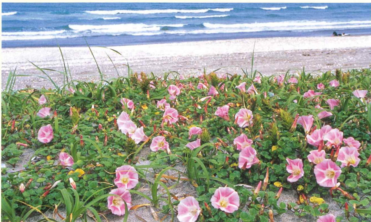
一浜ひろがおー（鹿嶋市）いばらき自然環境フォトコンテスト佳作