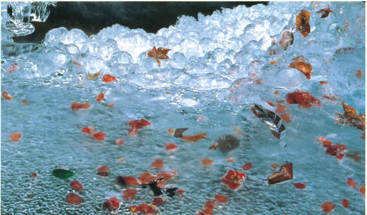
— 氷華 — (北茨城市) いばらき自然環境フォトコンテスト入選 撮影者 中村 竜子さん