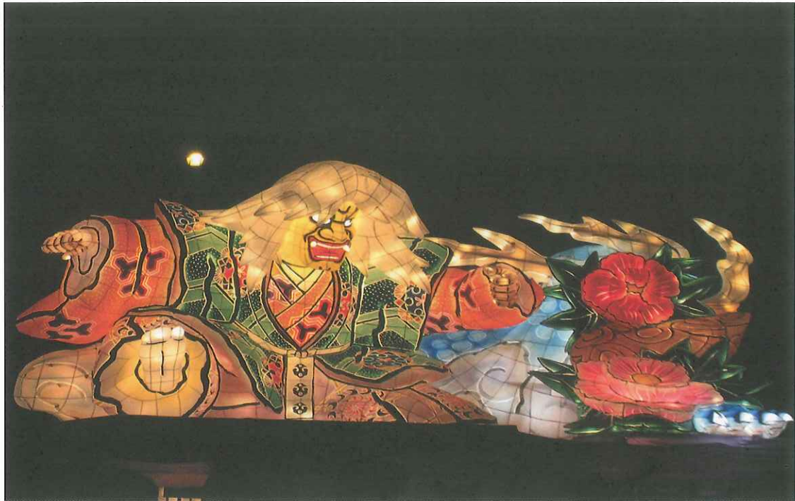
「笠間のまつり」での「光のオブジェ（ねぶた）&神輿パレード」。市民の手作りのものから、本場青森の迫力あるものまで、多くねぶたが連なる様は圧巻。：8/17（土）（笠間市内中心街）「笠間市観光課」