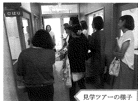
見学ツアーの様子

つくば市は待機児童数が県内で最も多く、保育士の確保が重要な課題であることから、見学先の各保育施設によるPRにも熱が入り、「一緒に