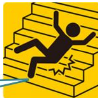
階段での踏み外しによる転倒 (足下の安全確認)