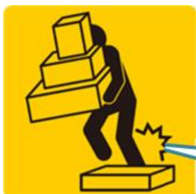
つまづきによる転倒(整理整頓)