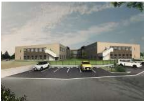
「特別養護老人ホームかつた」イメージ