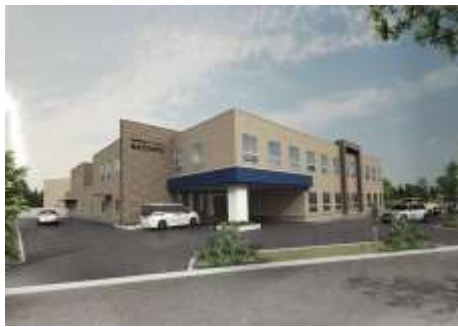
「みと東部特別養護老人ホーム」

※当日参加希望の方は必ず開催時間前にハローワークにご連絡ください ※雇用保険受給者の求職活動実績になります