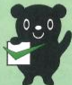
最低賃金制度のマスコット チェックマン