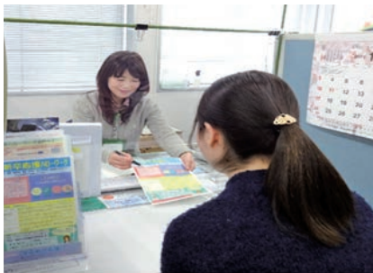
個別支援による相談