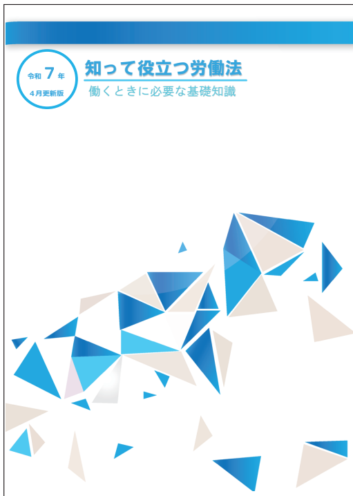
「知って役立つ労働法～働くときに必要な基礎知識～」 ( https://www.mhlw.go.jp/content/001558815.pdf )

若者向けに労働関係法令についてわかりやすくまとめた冊子を作成しています。厚生労働省のホームページから無料でダウンロードできますので、ご活用ください。