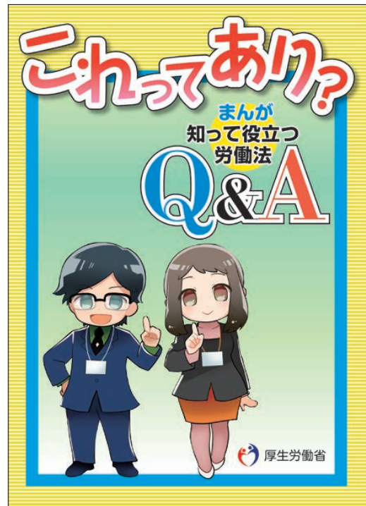
「これってあり?～まんが知って役立つ労働法 Q&A～」 ( https://www.mhlw.go.jp/stf/seisakunitsuite/bunya/mangaroudouhou.html )