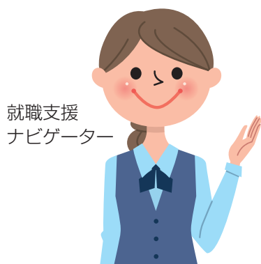
就職支援 ナビゲーター