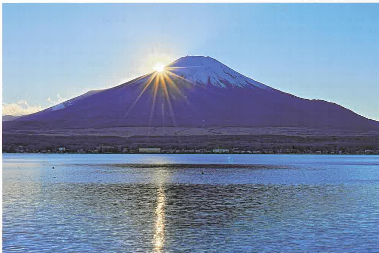
霊峰煌めく(山梨県)