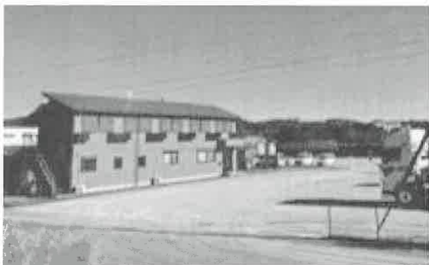
静岡県浜松市三ヶ日町に中継地点として設置した 三ヶ日営業所の全景