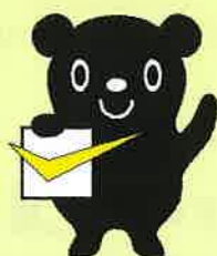
最低賃金制度のマスコット チェックマン