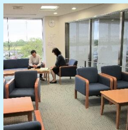
休憩可能なフリースペース