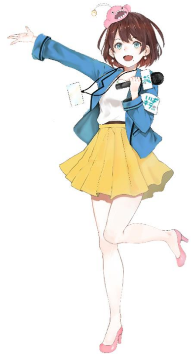
茨 ひより (茨城県公認Vtuber)