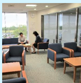
休憩可能なフリースペース