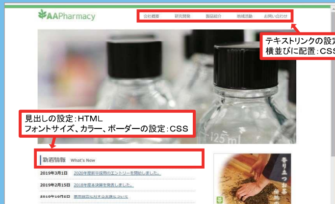
Web制作に必要なHTMLを基礎から習得!