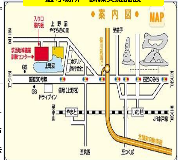
筑西地域職業訓練センター(桜川市下泉625-1)