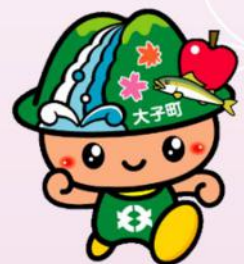
袋田の滝キャラクター たき丸