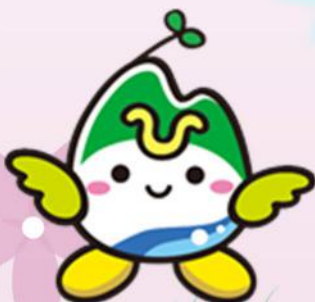
常陸大宮市マスコットキャラクター ひたまる