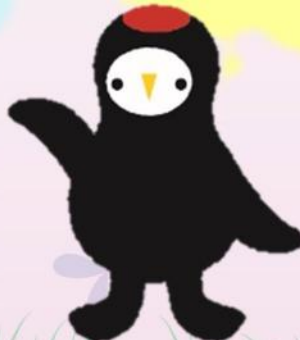
常陸太田市公式マスコットキャラクター じょうづるさん