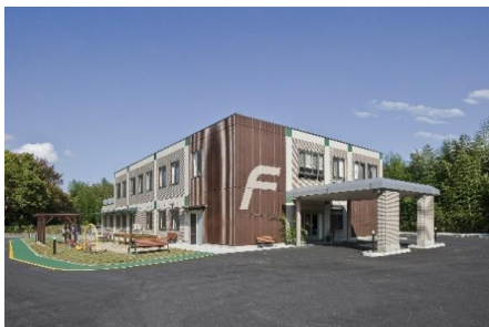
フロイデ総合在宅サポートセンター水戸河和田