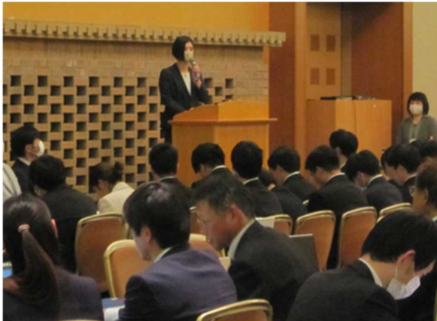
▲ 企業の1分間スピーチを真剣に聞いている。