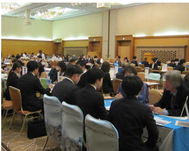
▲人事担当者との面接、質問、自己PRを頑張っている。

茨城労働局、県内各ハローワーク及び茨城県では、現在内定が得られていない大学等卒業予定者の就職活動を支援するため「2025年3月卒業予定の大学生等向けの就職面接会」を、また、同日に卒業年次前の学生を対象として、企業理解・職業理解の促進、及びインターンシップを始めとする学生のキャリア形成を支援するため「WEB（インターネット上の会場でビデオ通話）方式での業界研究会」を開催しました。