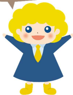
パートタイム・有期雇用労働法 キャラクター「パゆう」ちゃん