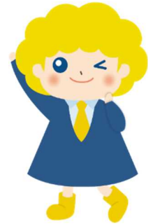
パートタイム・有期雇用労働法キャラクター 「バゆう」ちゃん