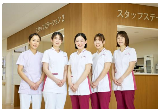
当院は兵庫県「仕事と生活の調和推進認定企業」です。