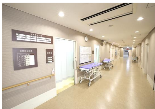
内観：210床の回復期・慢性期病院です。