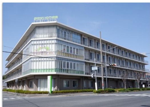
病院外観(R171北側・産業道路沿いに立地)