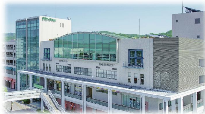
アスティアかさい