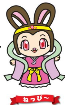
ふるさと加西観光大使