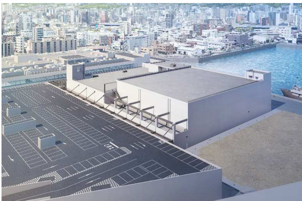
外観鳥瞰図（南東側から望む）