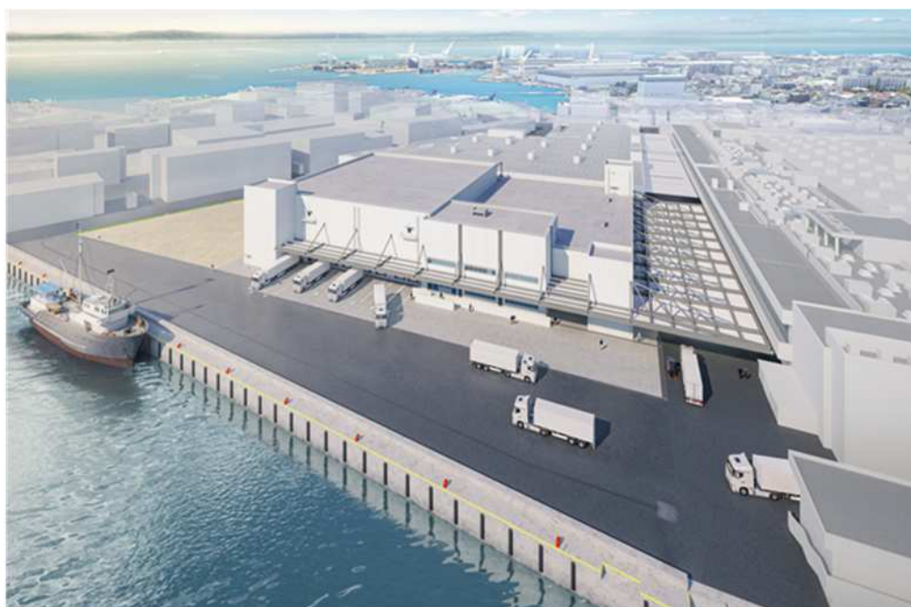
外観鳥瞰図（北側から望む）