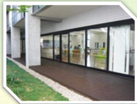
生活介護 はくほう

あなたに合った職種、職場、勤務形態を 見つけて一緒に働いてみませんか！！ 未経験やブランクのある方でもOK！！