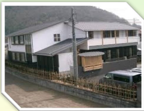
グループホーム 坂越の家