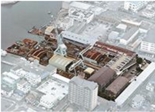
本社・吉田工場（神戸市兵庫区）