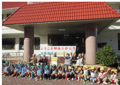
地元保育園との交流