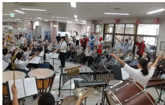
納涼祭での地元中学校