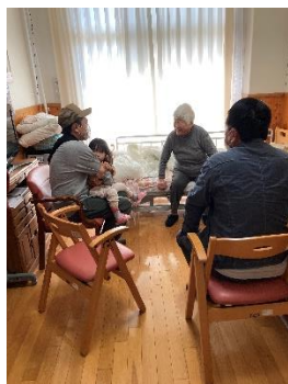
面会の様子 吹奏楽部演奏