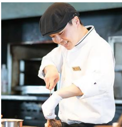
募集中の求人情報