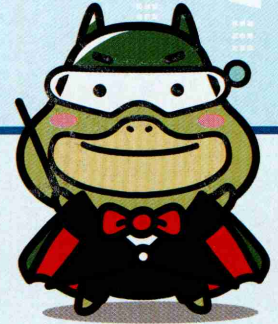
くらしはたらきマエストロ たしかめたん