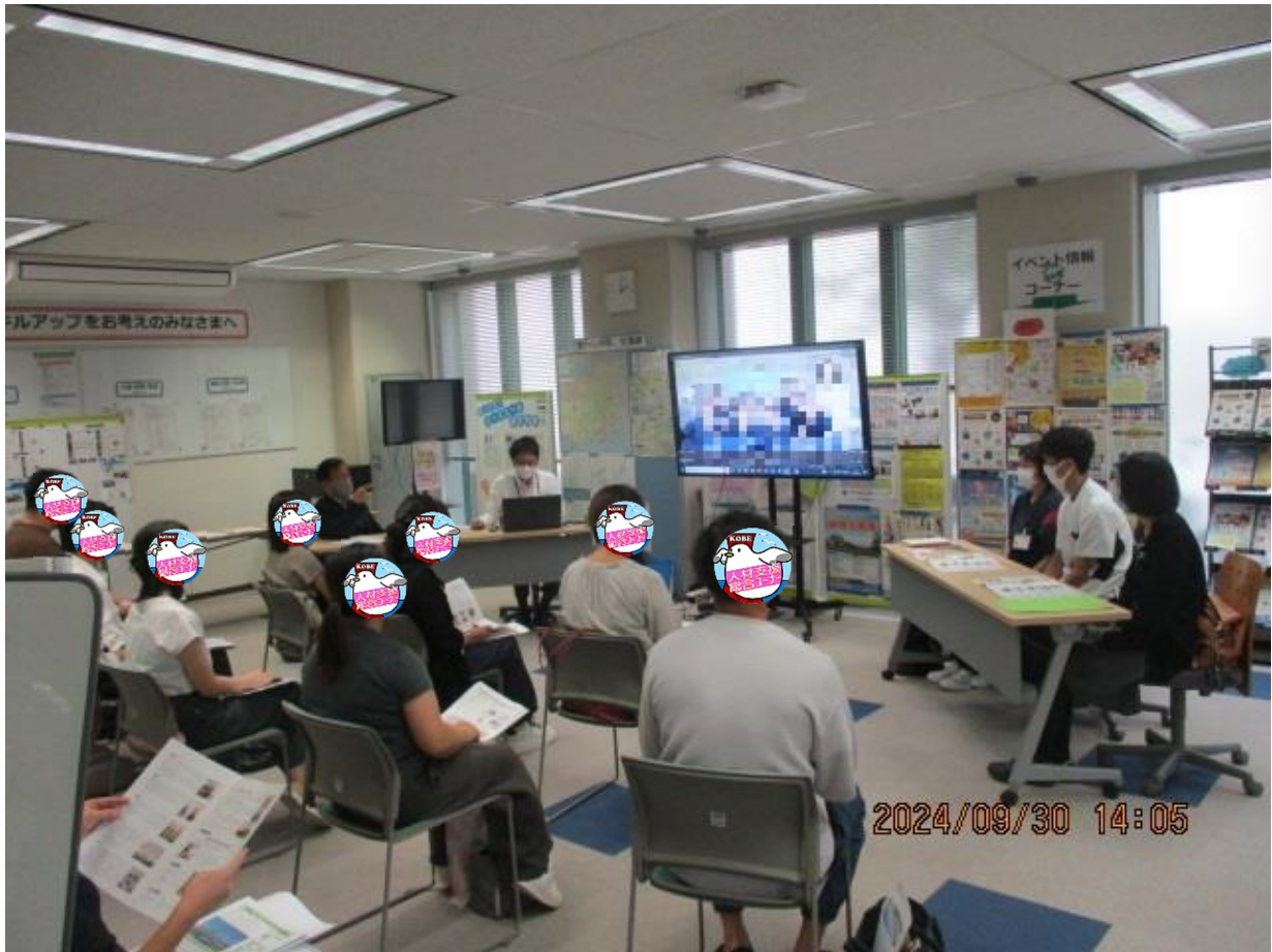
採用担当者の説明を聞く風景 1