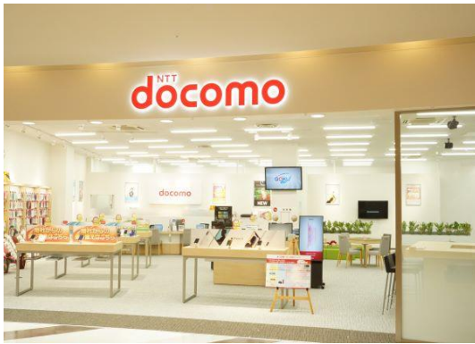
ドコモショップ ブルメール舞多間店