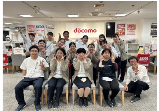
ドコモショップ 三宮さんプラザ店

「どうしたら喜ばれるだろう？」と考えながら、誠実・丁寧・プラスαのサービスで、一緒にご要望にお応えしていきましょう！