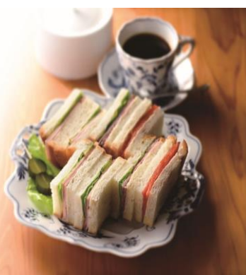
当店自慢のサンドイッチ