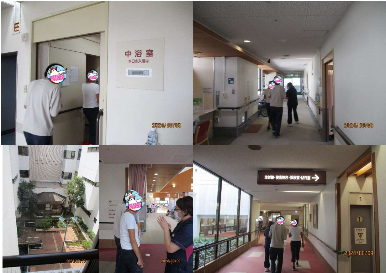
病院内を見学する風景 2