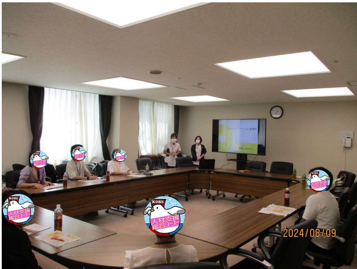
職場見学会 & お仕事相談会