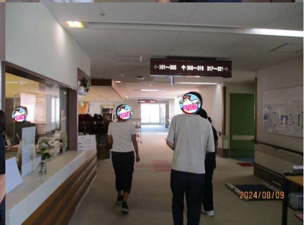
病院内を見学する風景 1