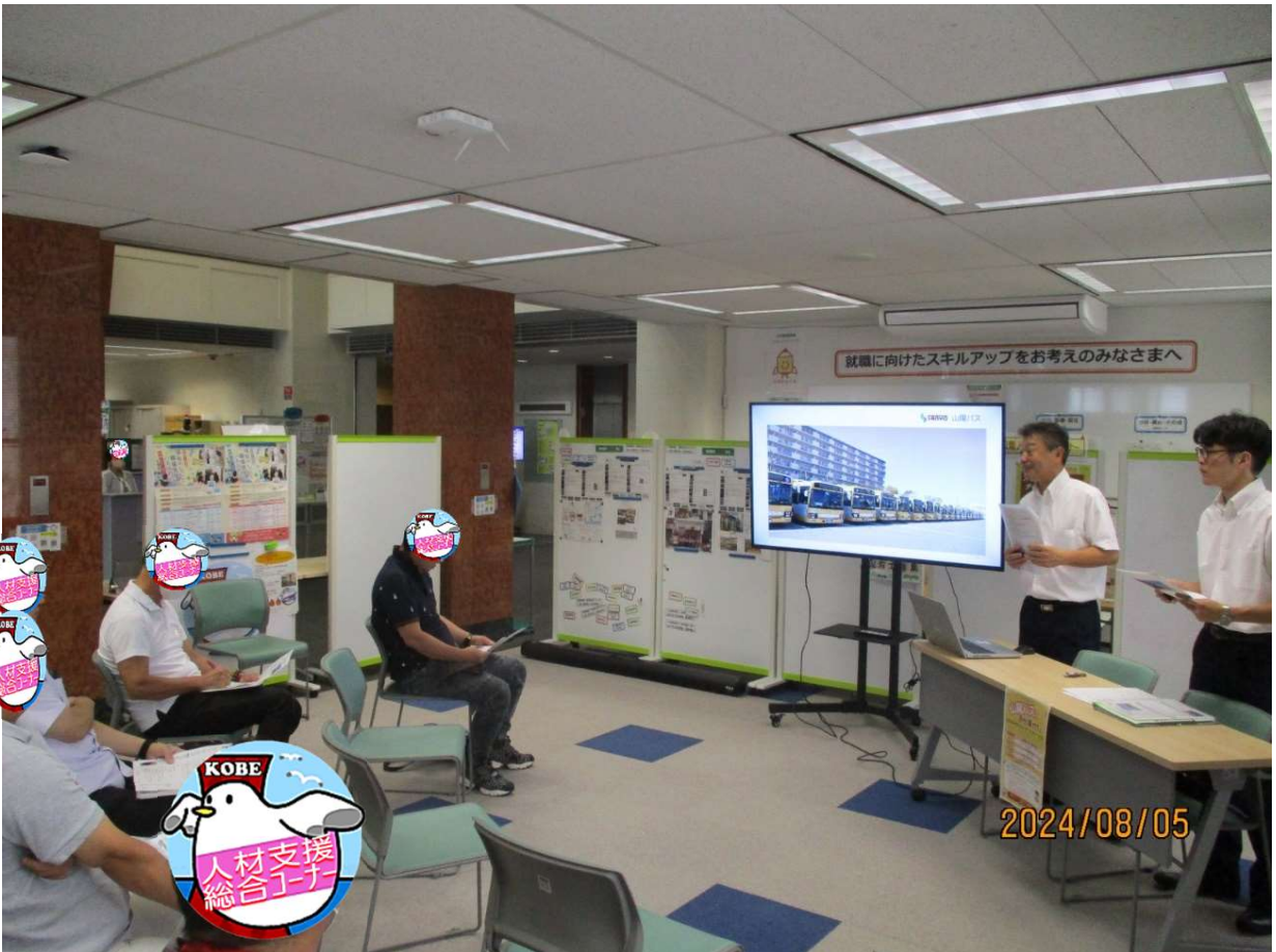
採用者の説明を聞く風景 2