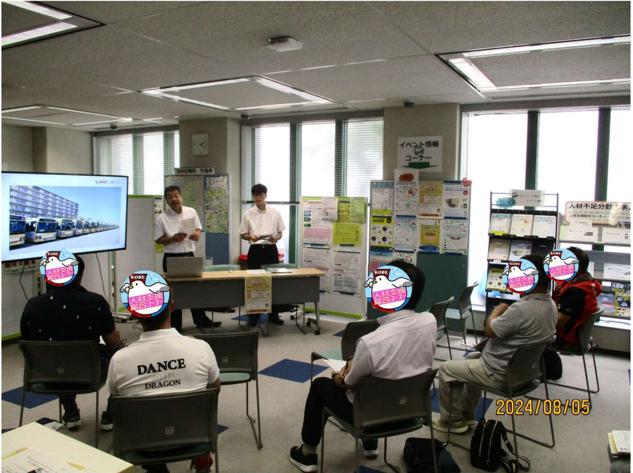
採用担当者の説明を聞く風景 1