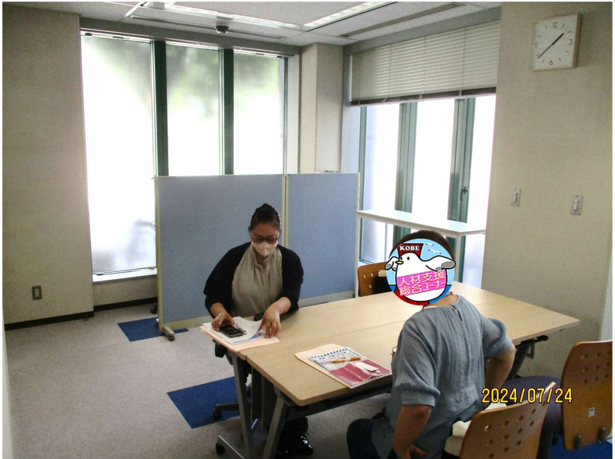
個別面談の風景（ご協力ありがとうございました。）