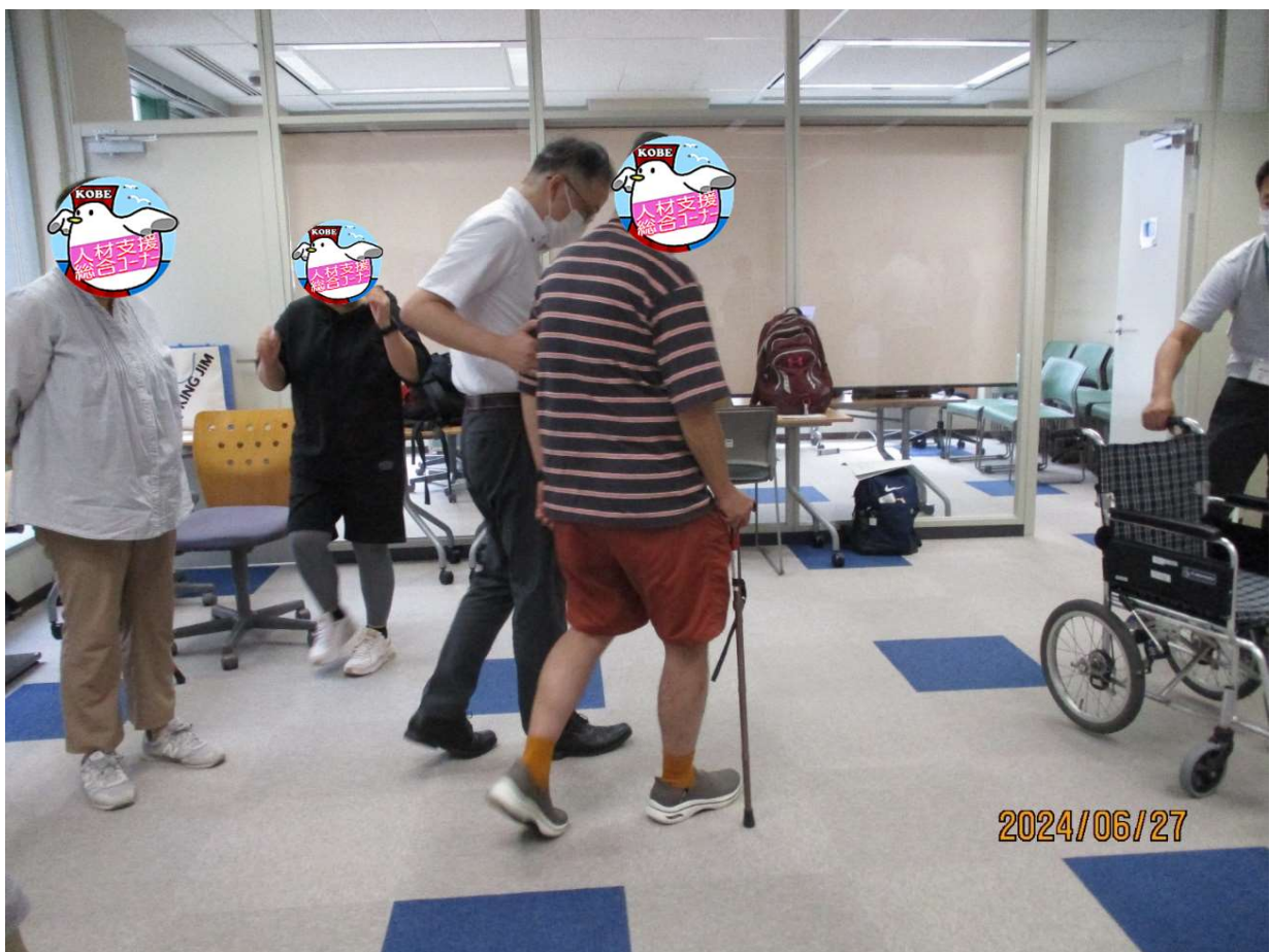
杖を利用する方の気持ちを体験する風景