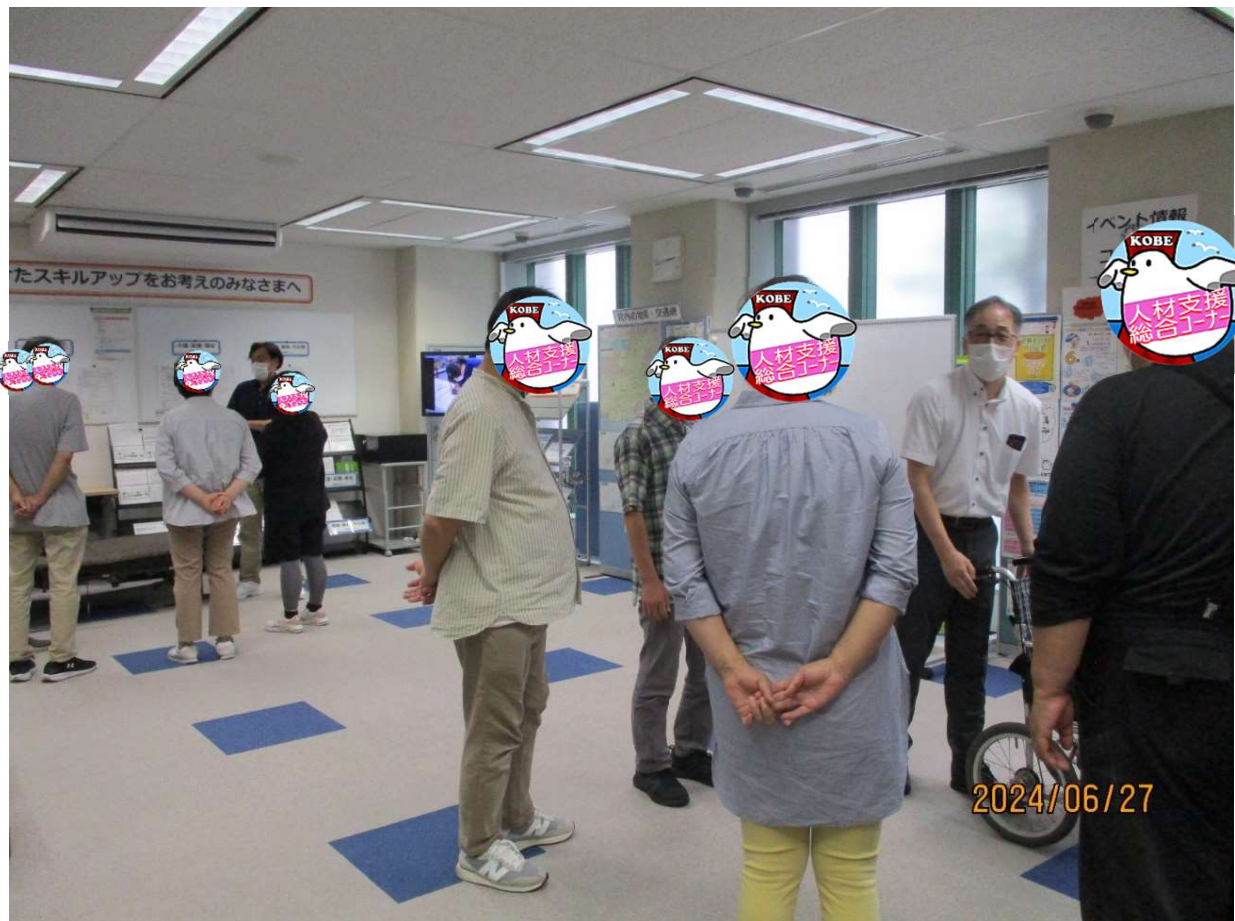
二手に分かれて体験会スタート！