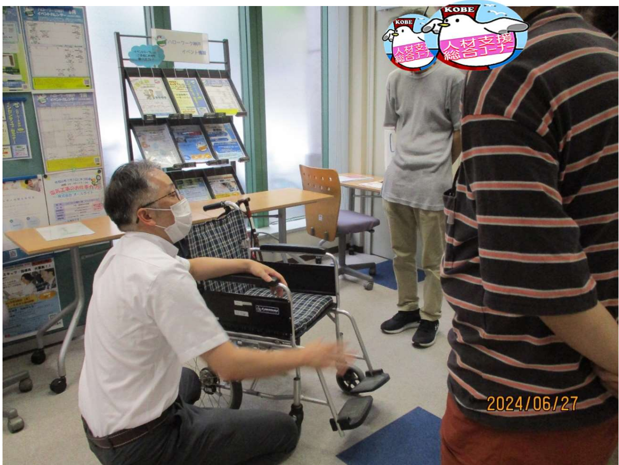
「車イス」について説明を受ける風景