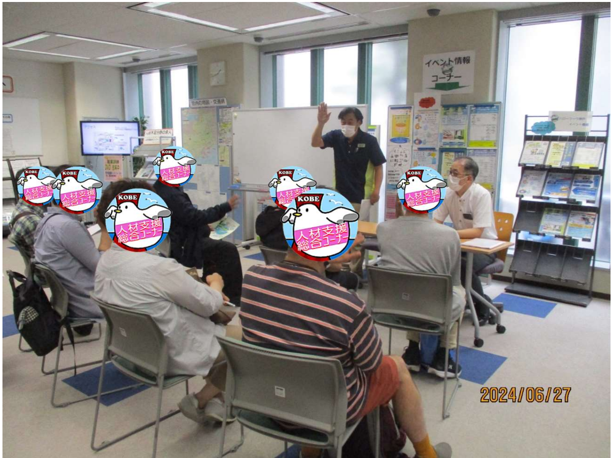
事業所の説明を聞く風景