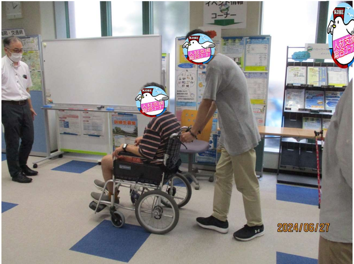
車イスに「乗る側」と「押す側」に分かれて体験する風景