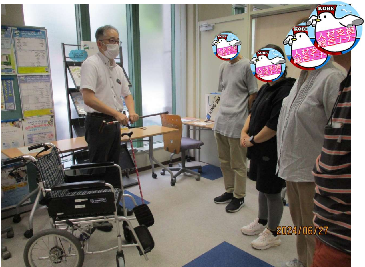
「杖」の使い方について説明を受ける風景