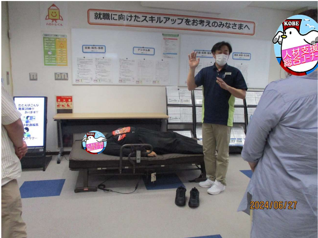
理学療法士の方より「ベッド周りの介護」について説明を受ける風景