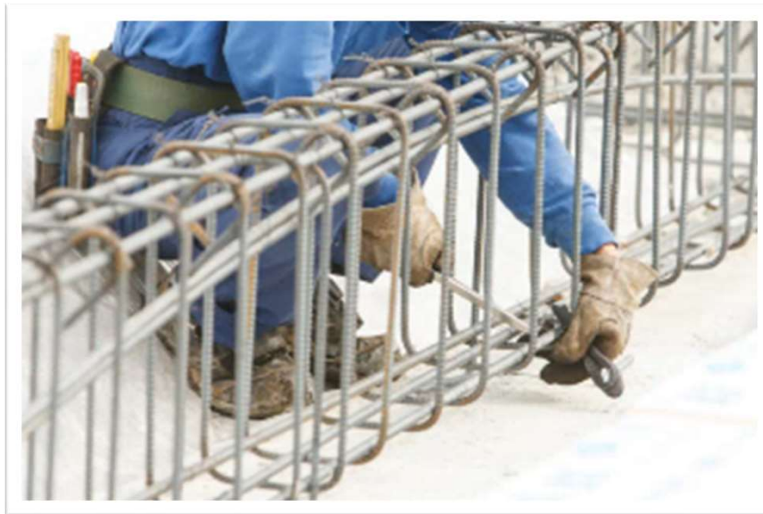
※現場での作業イメージ

建物の骨組みとなる鉄筋を組み立てる仕事で建物の強度に大きく関わる重要な役割を担っています。