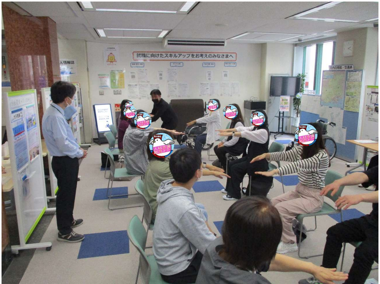
介護体験をしている風景 1