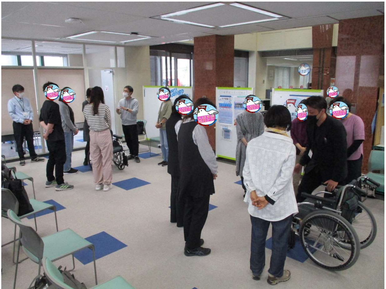
車いすの使用方法を聞く参加者