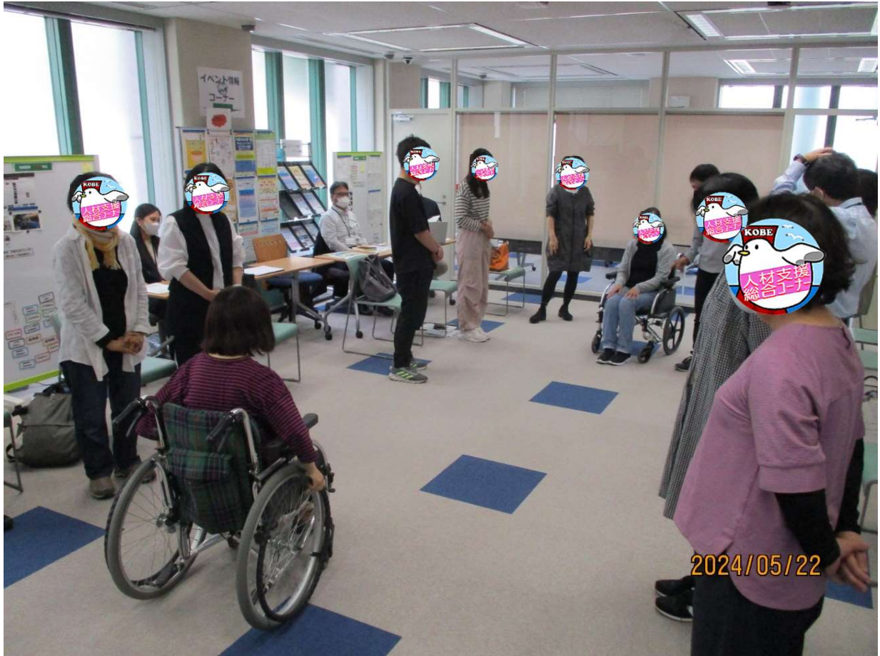
介護の体験相談会