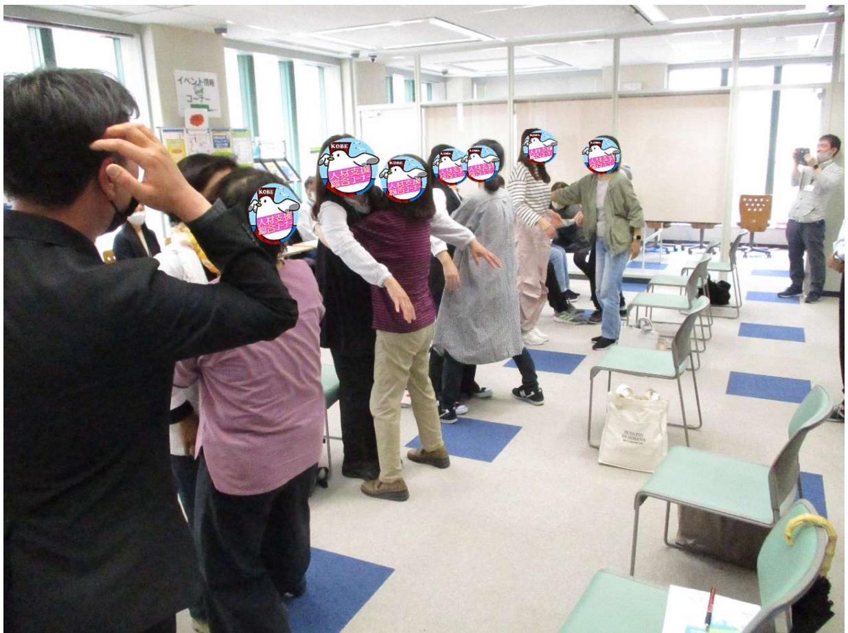
介護体験をしている風景 2