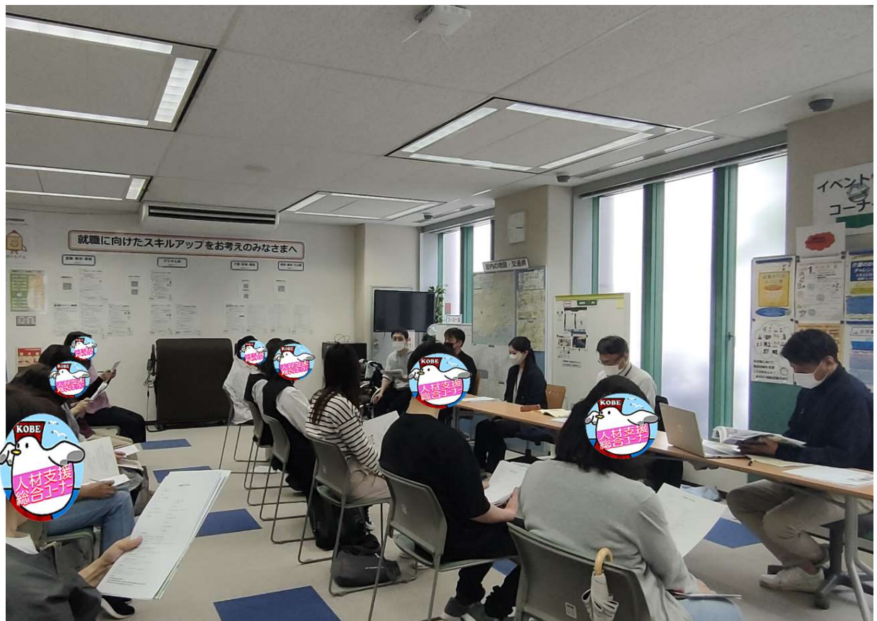
事業所の説明に聞き入る参加者