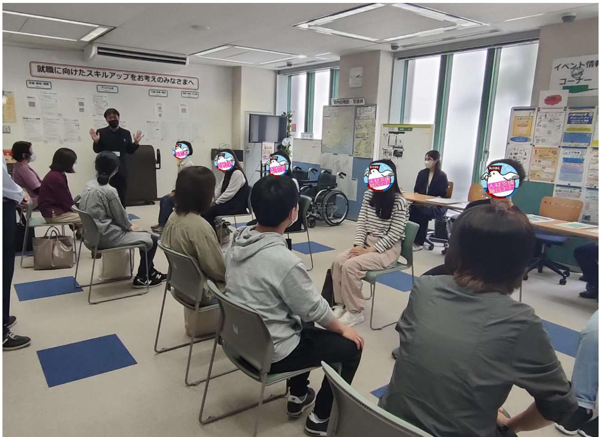
介護体験の説明を聞く参加者 1