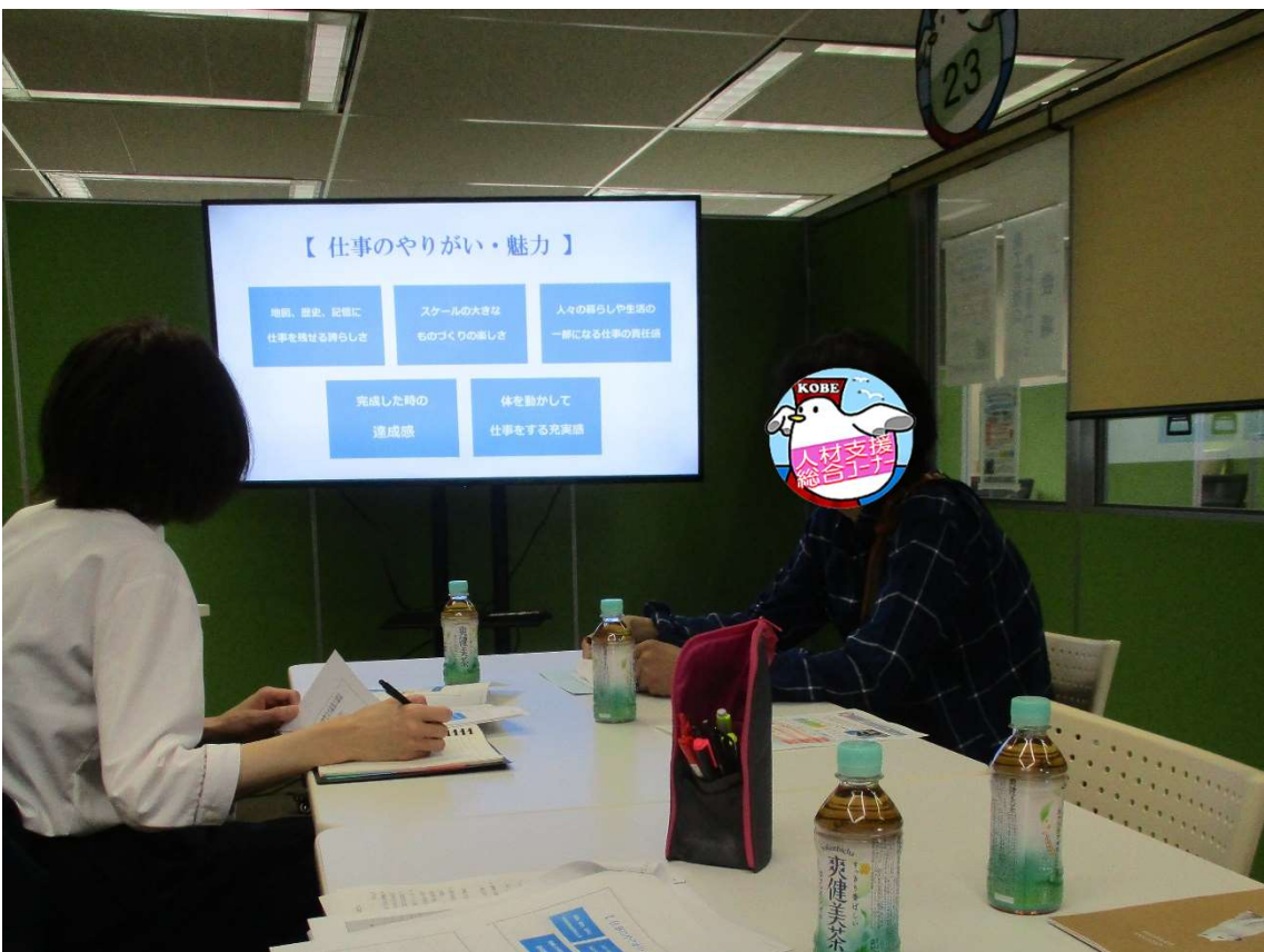
採用担当者の説明を聞く参加者 2