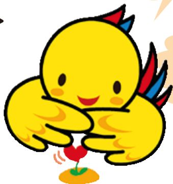
兵庫県マスコット はばタン