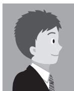
10 正面を向いていないもの（顔が正面を向いていても体が横を向いているもの、 視線が正面を向いていないものは不可）