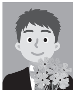
6 人物の手前に物が写り 込んでいるもの