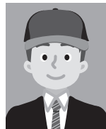
7 帽子などをかぶって いるもの