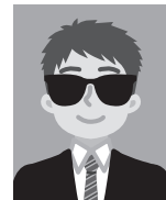
9 色の濃い眼鏡などをかけているもの （瞳が確認できないものは不可）