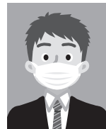
8 マスクをしているもの