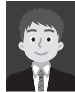
4 着衣と背景が 類似色のもの