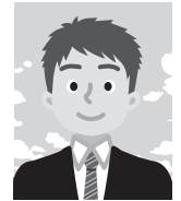
5 背景が無地で ないもの