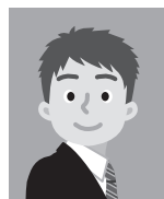
11 平常の表情と著しく 異なるもの