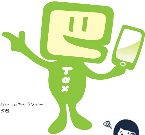
国税庁e-Taxキャラクター： イータ君

国税の場合はe-Tax、地方税の場合はeLTAXを利用して、事前に届出をした預貯金口座からの振替により、簡単な操作で税金を納付することができる便利な電子納税の手段です。