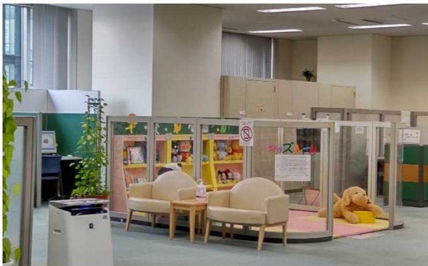
マザーズハローワーク三宮