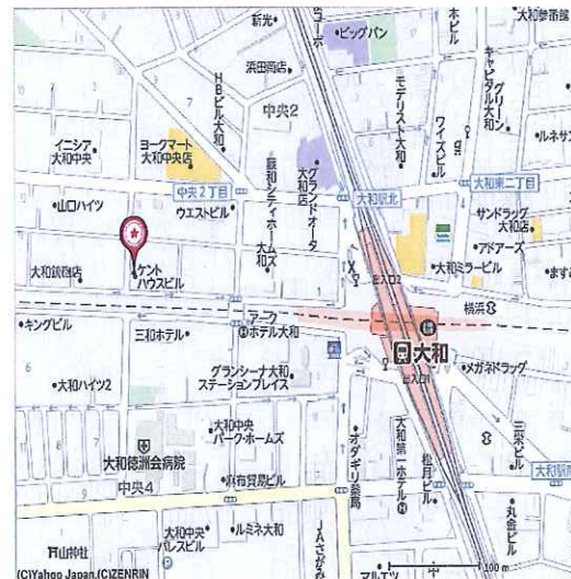
小田急線 相鉄線 大和駅より徒歩5分

給 与: 時間給、諸手当、有給休暇を含む総支給額 福 利 費 等: 健康保険、介護保険、厚生年金、雇用保険、労災保険、健康診断等 会社運営費: 人件費、オフィス、事務経費、募集広告費等会社運営にかかる諸経費 営 業 利 益: 上記経費を差引いた会社の利益