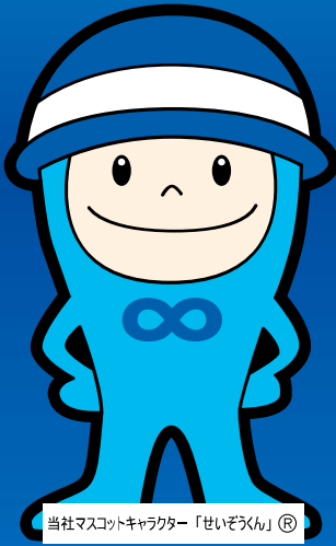
当社マスコットキャラクター「せいぞろくん」®

※上記以外にも各営業所・オフィスがございます。他拠点の詳細につきましては、裏面をご確認ください。