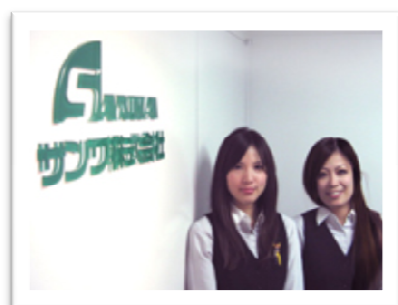
納得のいく転職をバックアップ！